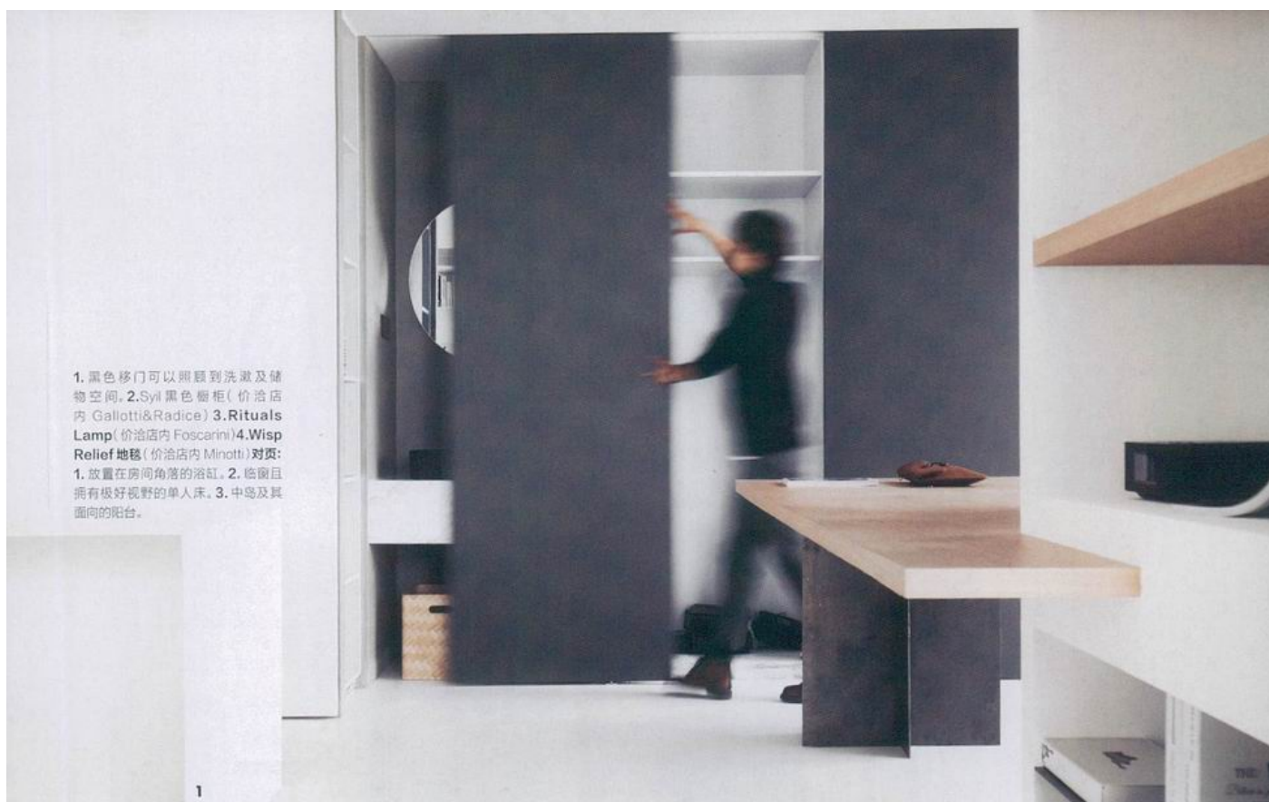
1. 黑色移门可以照顾到洗漱及储物空间。2. Syl 黑色橱柜(价洽店内 Gallotti&Radice) 3. Rituals Lamp(价洽店内 Foscarini) 4. Wisp Relief 地毯(价洽店内 Minotti) 对页: 1. 放置在房间角落的浴缸。2. 临窗且拥有极好视野的单人床。3. 中岛及其面向的阳台。