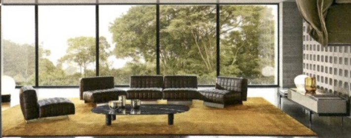
Modulair zitsysteem Twiggy van Minotti heeft blokvormige stikfels. Ook mooi: alleen de chaise longue, p.o.a.