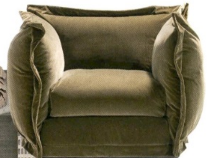
'Fauteuil' doet oneseater Cloudscape uit de Diesel-collectie van Moroso geen recht. Zitten op een wolk, v.a. € 3.781.