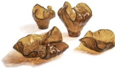
Vaas Water Illusione van Poltrona Frau is van gegoten gerecycled glas, € 387.

De waarde van ruimte, uitgedrukt in tijdloze klasse.