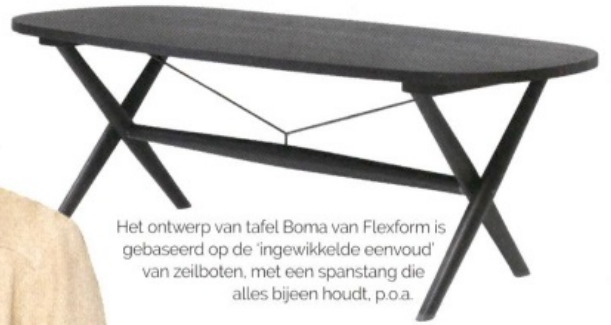
Het ontwerp van tafel Boma van Flexform is gebaseerd op de 'ingewikkelde eenvoud' van zeilboten, met een spanstang die alles bijeen houdt, p.o.a.