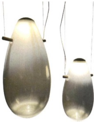
Even simpel als sierlijk: hanglamp Drop van Linteloo, 38 cm € 938, 52 cm € 1.146.