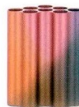
Nuage abstrait di Ronan e Erwan Bouroullec per Vitra