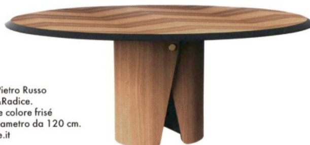
MANTO di Pietro Russo per Gallotti&Radice. Piano in noce colore frisé intarsiata. Diametro da 120 cm. gallottiradice.it