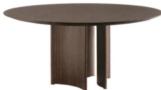
ALAN di Gabriele e Oscar Buratti per Porada. In noce canaletto, piano in legno, marmo o cristallo. Anche in versione rettangolare. porada.it