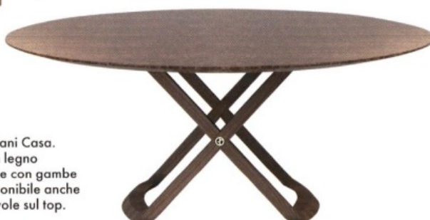
PLANET di Armani Casa. Tavolo tondo in legno di tamo marrone con gambe incrociate. Disponibile anche con piano girevole sul top. armani.com