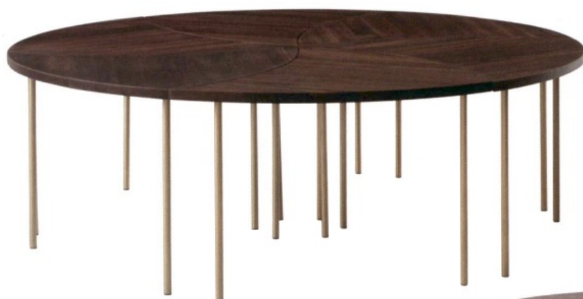
PINWHEEL di Hvidt & Mølgaard per &Tradition. Riedizione di un pezzo del 1953. In noce o quercia con gambe in ottone. andtradition.com

Tondi, rettangolari, articolati, con intarsi. Ideali per pranzi di design, quest'anno i tavoli sono protagonisti negli interior