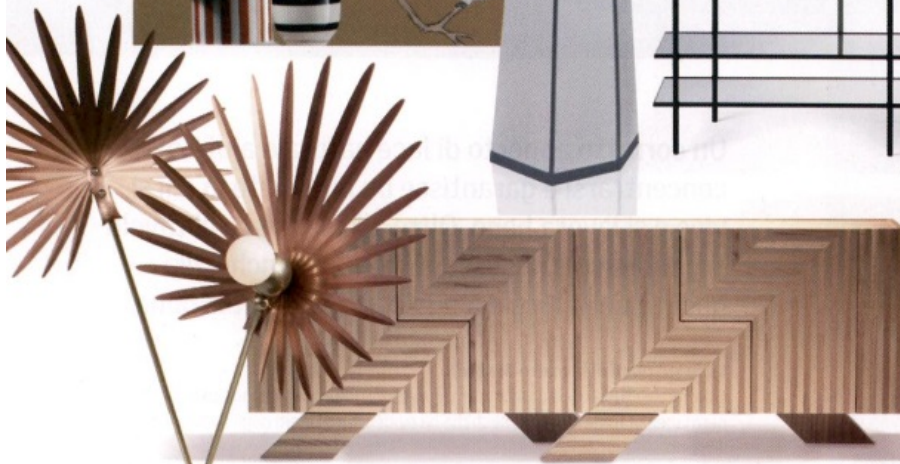
LEZIOSA Lampada in rame e ottone, con base in marmo, Inez di Rosie Li. rosieli.com