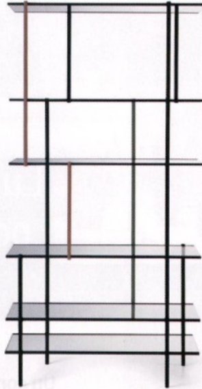
LEGGEREZZA Libreria in alluminio e vetro, Drizzle di Gallotti&Radice. gallottiradice.it