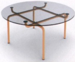
INDUSTRIAL Tavolo con base in acciaio e piano vetro, Edison di Cassina. cassina.com