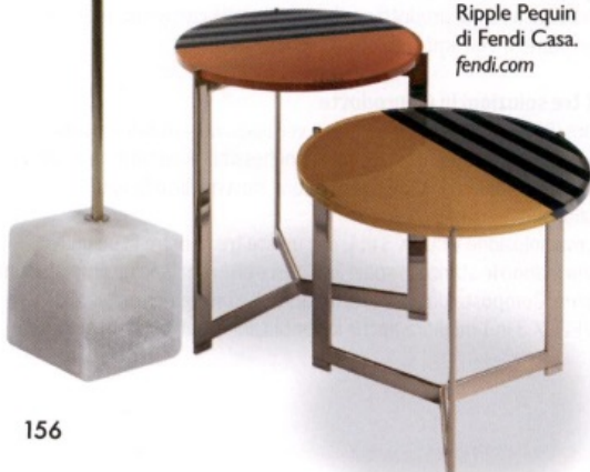
SOLARE Tavolini in acciaio e vetro laccato, Ripple Pequin di Fendi Casa. fendi.com