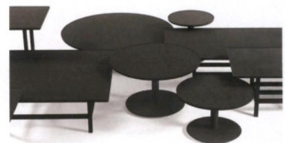
TIME&STYLE DEPADOVA Imperial family, tavolini in legno