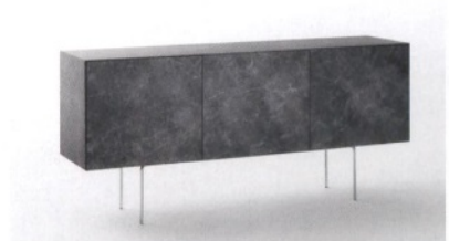
GLAS ITALIA Magic box, madia rifinita in gres porcellanato