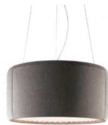
LUCEPLAN Silenzio, luce con rivestimento fonoassorbente