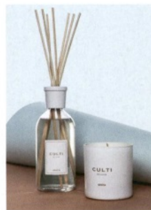
CULTI MILANO Gratia, profumatori per l'ambiente