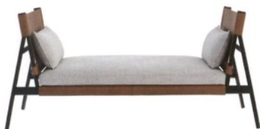
PORRO Traveller, panchetta realizzata in metallo e cuoio