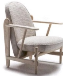
CECCOTTI T-bone, poltroncina in legno imbottita