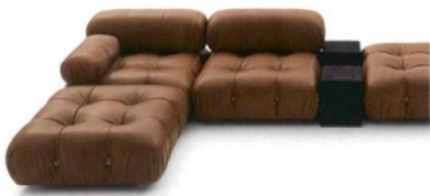
B&B ITALIA Camaleonda, divano modulare in cuoio