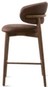
CALLIGARIS Oleandro, sgabello con struttura in legno