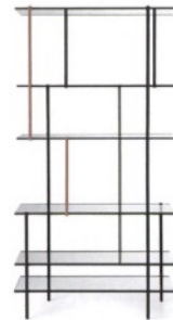
GALLOTTI & RADICE Drizzle, libreria in alluminio e ottone