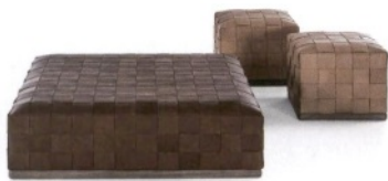
FRIGERIO Jonas, serie di pouf in pelle intrecciata