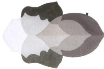
CARPET EDITION Foliage, tappeto in lana multicolore