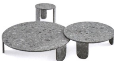
GALLOTTI E RADICE Clemo, tavolini in pietra spazzolata