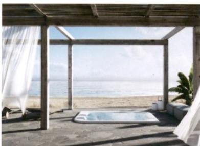
JACUZZI Virtus, idromassaggio con Clearray active oxygen