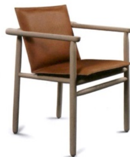
ZANAT Igman, sedia realizzata in legno e cuoio imbottito