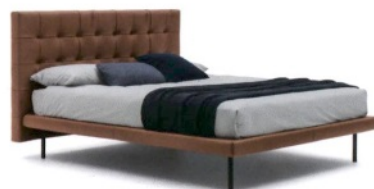
BOLZAN LETTI Freedom, letto con testata a capitonné