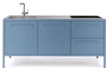
FANTINI Frame, cucina a tre moduli, in metallo e acciaio