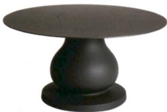
SLIDE Ottocento, tavolo da esterni in polietilene e laminato