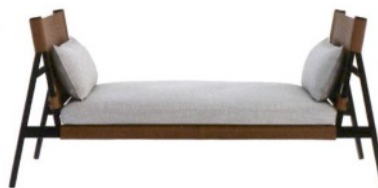
PORRO Traveller, divanetto-chaise longue in metallo e pelle