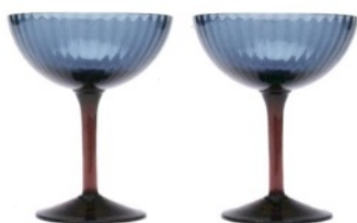
LA DOUBLE J Champagne coupe, steli in vetro veneziano