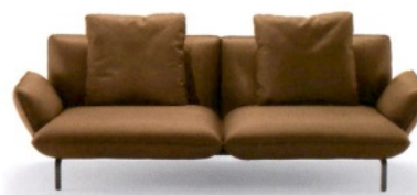
ZANOTTA Dove, divano a due posti con cuscini mobili