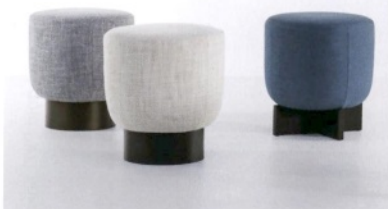
BONALDO Belt e Cross, pouf in tessuto con base in legno