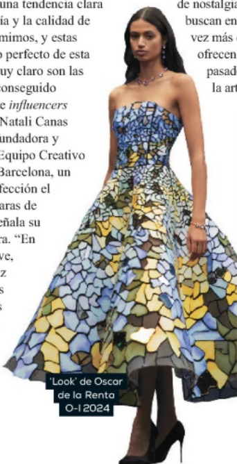
'Look' de Oscar de la Renta O-I 2024