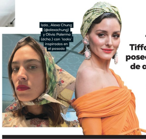
Izda., Alexa Chung (@alexachung) y Olivia Palermo (dcha.) con 'looks' inspirados en el pasado

complementar un buen mueble... La mezcla de estilos por la que apostamos forma parte de su característica decorativa, y por ello, las lámparas vintage recogen y permiten esta mezcla”, indica.