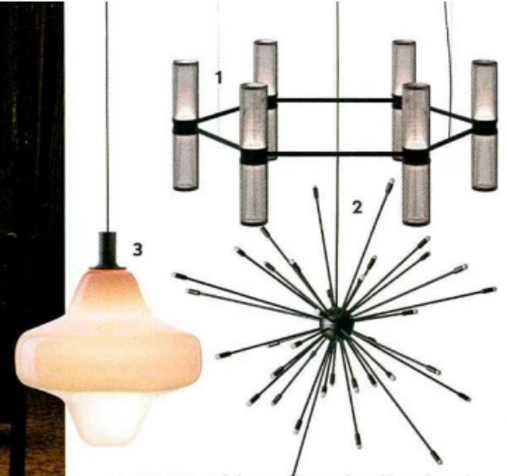
1 ZEPHYR Minimalistischer Kronleuchter von Artemide. Typisch für das modulare Leuchtensystem ist der zylindrische Doppeldiffusor. Design Carlo Colombo