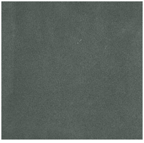
Suede grey 058